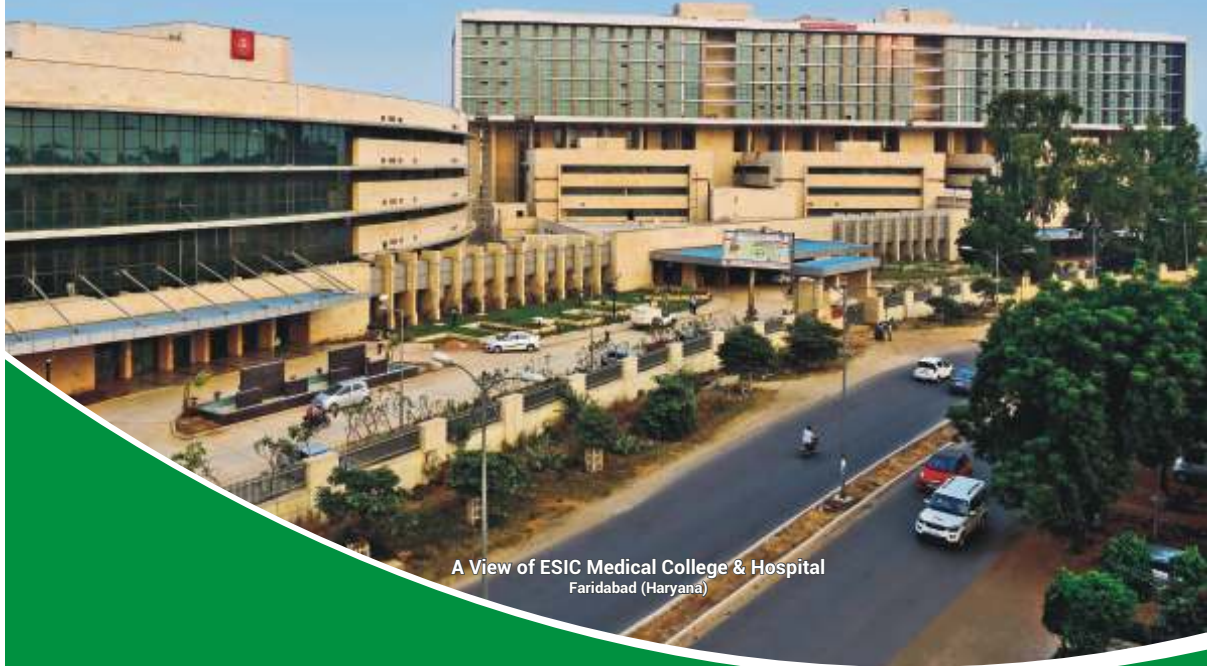
A View of ESIC Medical College & Hospital Faridabad (Haryana)