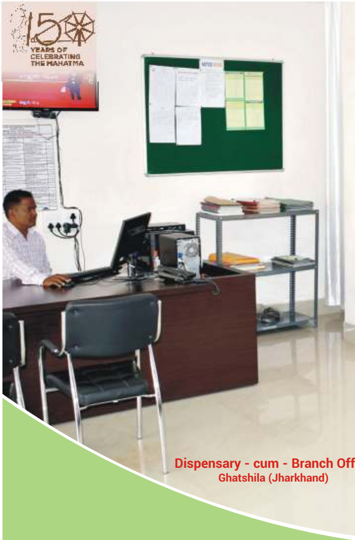
Dispensary - cum - Branch Office Ghatshila (Jharkhand)